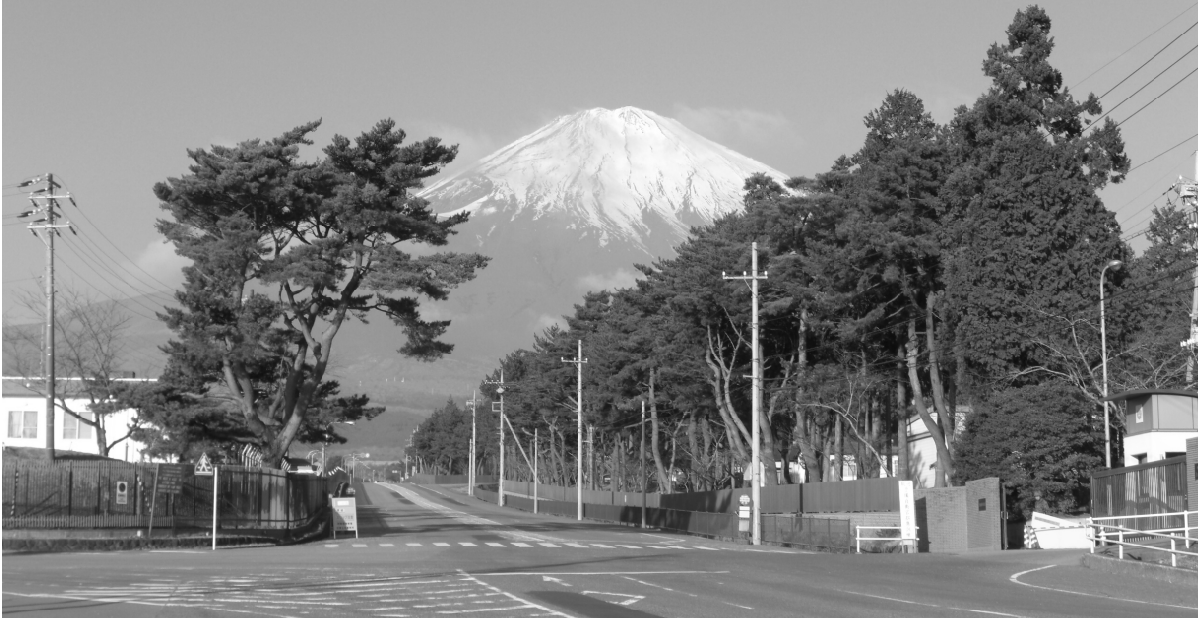
富士分会事務所から富士山を望む。左がキャンプ富士、右が陸上自衛隊滝ヶ原駐屯地